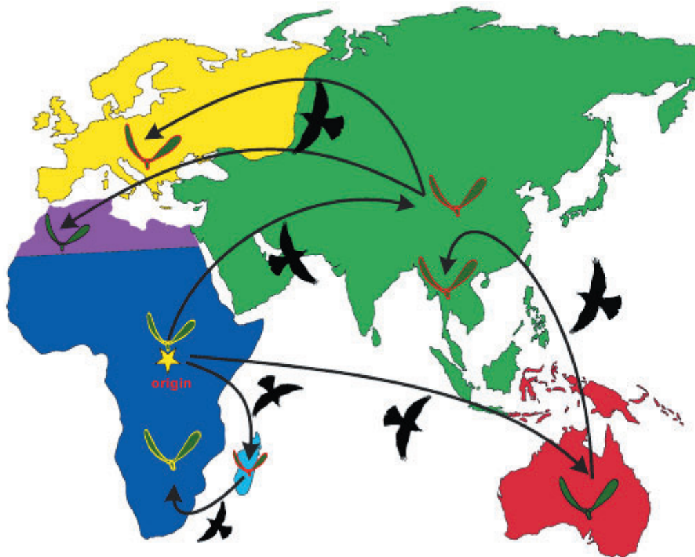
Рис. 1. Біогеографічна історія Viscum

Графічно узагальнена історія колонізації Австралії, континентальної Азії та Європи з Африки. Стрілка вказує на незалежну подію колонізації, а зірка передбачає ймовірне походження ViscumL. , з Африки.